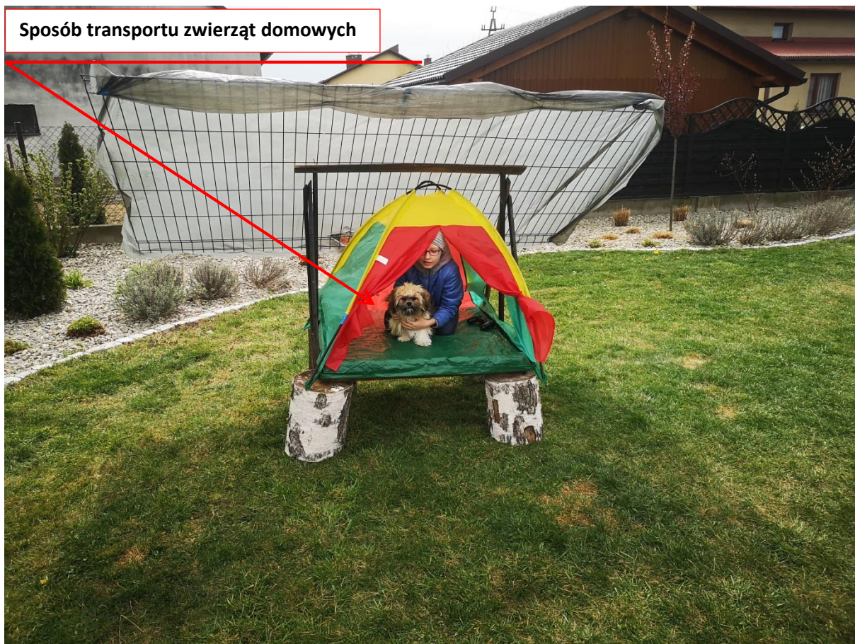
Zdjęcie 3. Sposób przewożenia pasażerów.

Kabina może pomieścić dowolną liczbę zwierząt domowych.