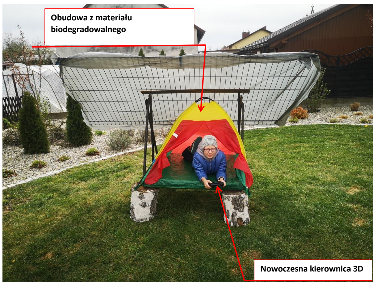
Zdjęcie 1. Widok z przodu

Mój pojazd przyszłości nazwałem Fut'fence . Kabina jest wykonana z elastycznego i w pełni biodegradowalnego materiału. Stanowi doskonałą barierę przed wiatrem, śniegiem oraz kwaśnym deszczem. Zawiera dwa otwory: jeden jest oknem, a drugi to nowoczesne, nigdy zasuwane się drzwi. Pojazd doskonale sprawdza się w każdym środowisku: może służyć jako łódź podwodna, samolot czy jako samochód z poprzedniej epoki. Fut'fence jest w pełni bezpiecznym pojazdem, o przestronnym wnętrzu i niewielkich gabarytach przez co może zaparkować na każdym parkingu. Pojazd sterowany jest za pomocą nowoczesnej kierownicy 3D wykonanej na bazie PSP.